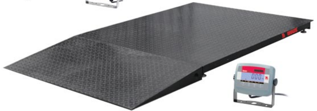
Plate-forme et rampe en acier peint avec indicateur T31P